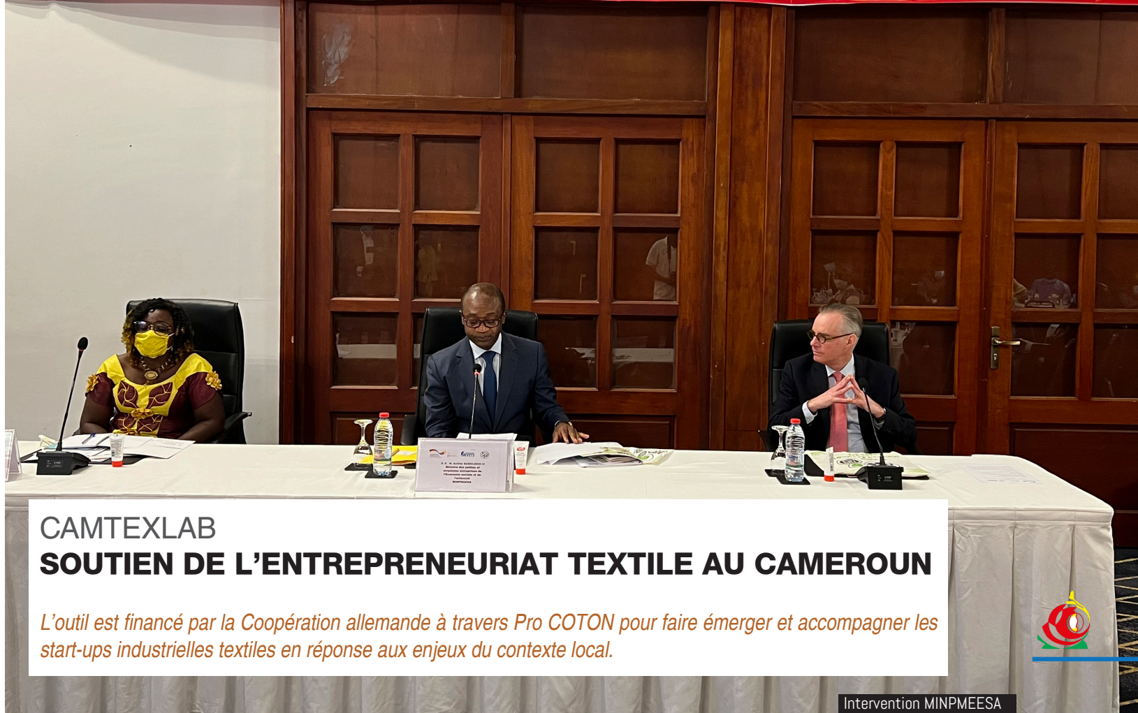
Table ronde/Round table, 09 Mars/March 2022, Hilton Hotel