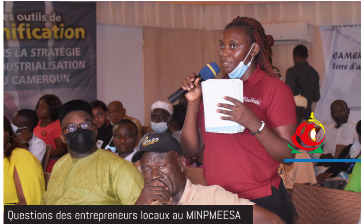
Questions des entrepreneurs locaux au MINPMEESA

des offres des entreprises marseillaises pour nouer des partenariats d'affaires avec notamment la foire Promote 2022 qui réunit près de huit-cents (800) entreprises. Il a souligné que le MINPMEESA s'engage à accompagner les différents acteurs pour consolider et pérenniser ces partenariats. La cérémonie a été marquée par une signature de convention entre Africalink et la Chambre d'Agriculture, des Pêches, de l'Élevage et des Forêts (CAPEF) du Cameroun.