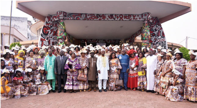
The Minister encourage his female personnel