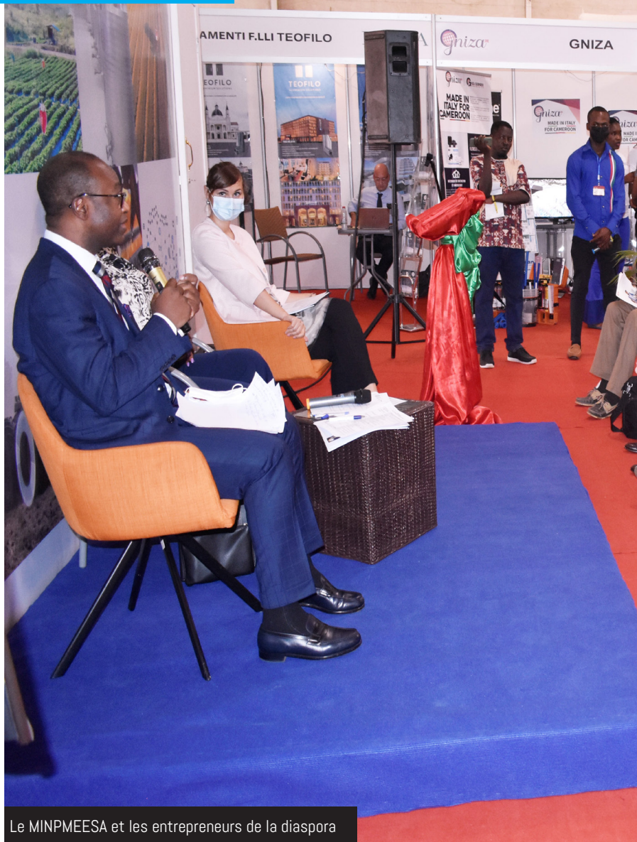
Le MINPMEESA et les entrepreneurs de la diaspora

It should be recalled that the Union of Arab Women Investors was launched on June 1st 2005 during the activities of the session of the Council of Arab Economic Unity at the ministerial level under its resolution N°1272. The Union hence became an Arab non-governmental organization that works within the framework of the League of Arab States. The Union of Arab Women Investors has records 17 Arab member countries.