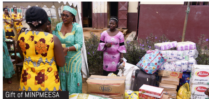
Gift of MINPMEESA

The Women of MINPMEESA have undertaken a series of activities in the course of a week to mark the 37th edition of the International Women's day celebrated under the theme "Female and male equality today for a sustainable future". In prelude to the 8th of March, they was treated to a conference, health screening, training workshop, sports walk, charity visit, the march pass at the 20th May Boulevard and finally a festive lunch.