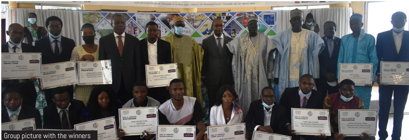
Group picture with the winners

Chaired by H.E Minister Achille BASSILEKIN III alongside the Minister MOUNOUNA Foutsou of Youth and Civic Education, the 2nd call for project proposals of the Prototyping Support Fund and the award ceremony of the 2nd batch of laureates for this fund took place on the 10th of March 2022 at the esplanade of the Yaoundé Municipal Circle hall.