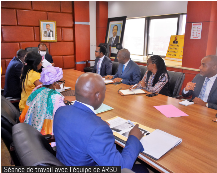
Séance de travail avec l'équipe de ARSO