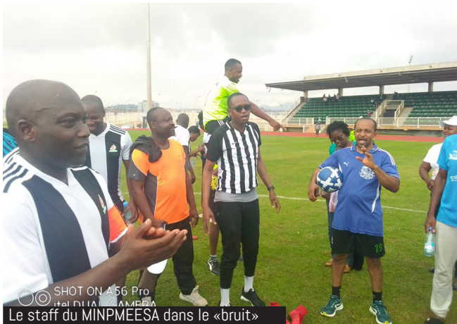
Le staff du MINPMEESA dans le «bruit»

Plusieurs activités ont marqué cette célébration et ont permis une communion entre le personnel et les responsables du Ministère