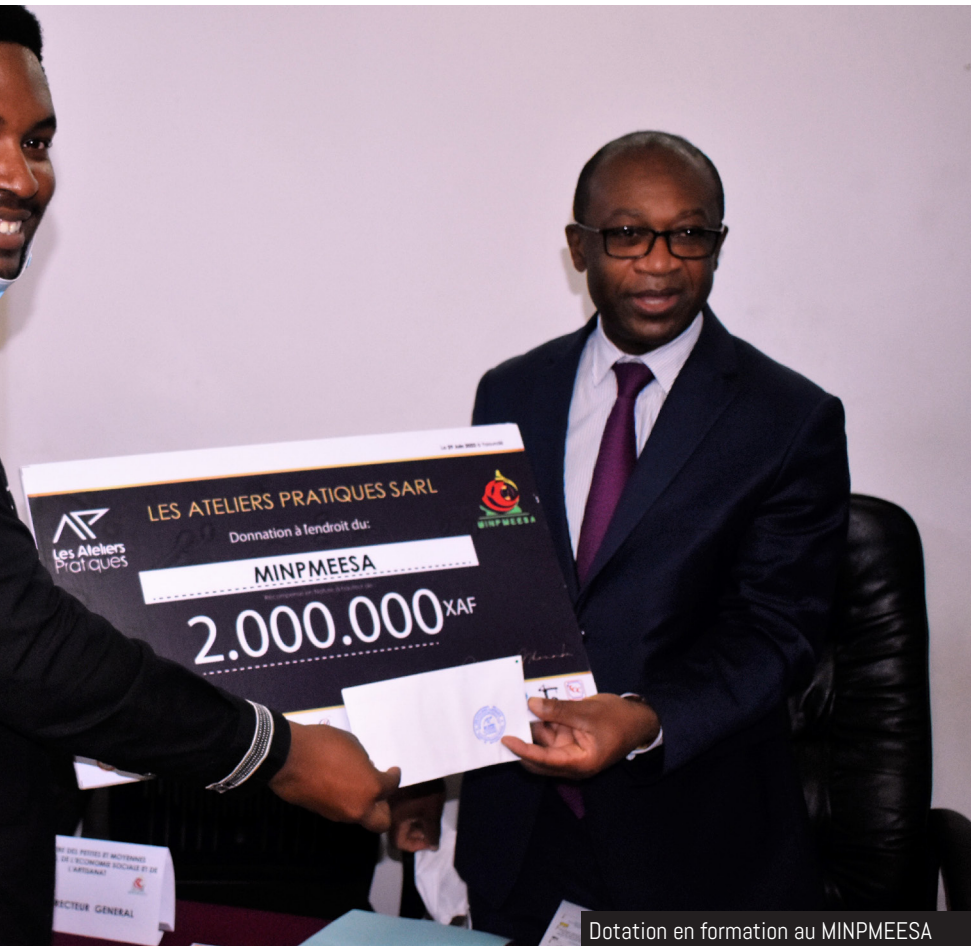
Dotation en formation au MINPMEESA