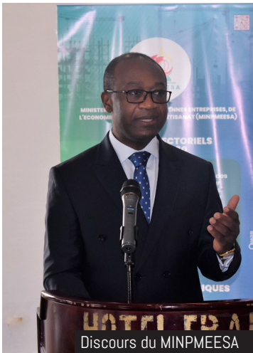
Discours du MINPMEESA