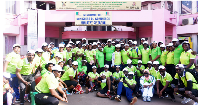
Joy to meet far from the office