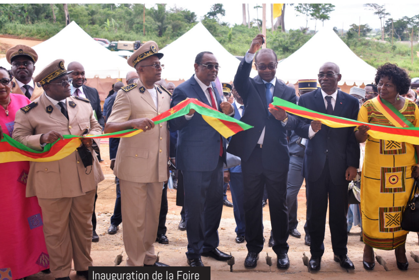
Inauguration de la Foire

L'inauguration de ce joyau architectural vient porter à 12 le nombre des Villages artisanaux au Cameroun, et renforcer le patrimoine de nouveaux édifices du Ministère des PMEESA.