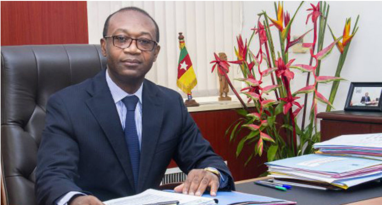
Achille Bassilekin III

MINISTRE DES PETITES ET MOYENNES ENTREPRISES, DE L'ECONOMIE SOCIALE ET DE L'ARTISANAT (MINPMEESA)