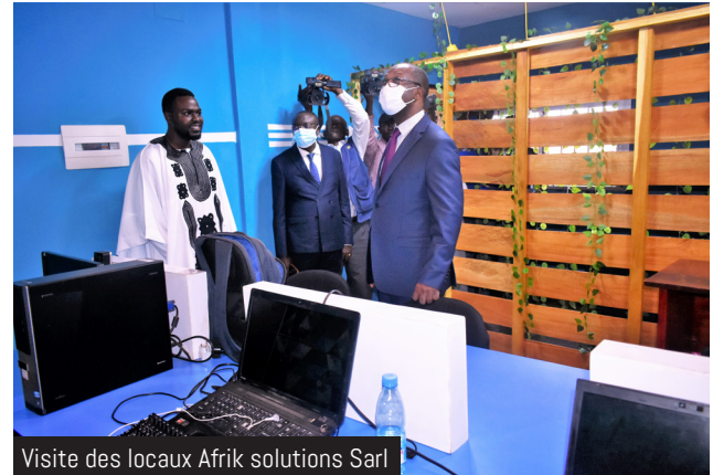
Visite des locaux Afrik solutions Sarl

MINPMEESA pour les Awards Les Ateliers Pratiques en cours de préparation. Pour marquer sa reconnaissance au MINPMEESA pour l'appui multiforme et l'encadrement dont il bénéficie depuis quelques années, Les Ateliers Pratiques ont offert des formations au digital pour le personnel du MINPMEESA à hauteur de 2 000 000 FCFA (deux millions), matérialisés par un chèque symbolique remis à Monsieur le Ministre des PMEESA. Touché par ce geste de reconnaissance, le Ministre des PMEESA a salué le dynamisme de cette équipe qui est « un exemple vivant de ce qu'il faut encourager ». Il lui a confirmé le parrainage du MINPMEESA pour les Awards à venir et l'a invitée à garder le cap puisqu'en tant qu'acteurs du développement local et régional, le travail qu'elle abat trouvera un meilleur écho et un appui financier important auprès des collectivités territoriales décentralisées.