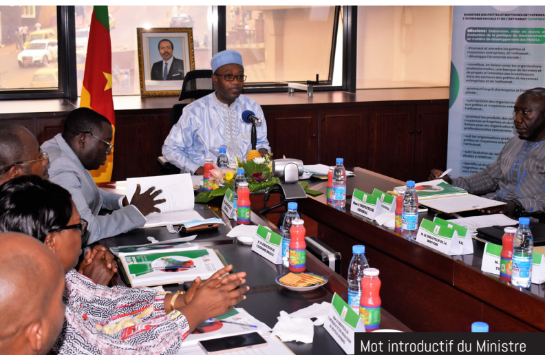
Mot introductif du Ministre

Les chiffres communiqués le 30 juin 2022 par le Ministre des PME, de l'Economie Sociale et de l'Artisanat témoignent d'une progression générale dans le domaine des PME