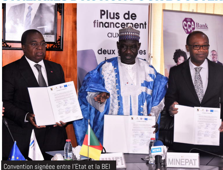
Convention signée entre l'Etat et la BEI