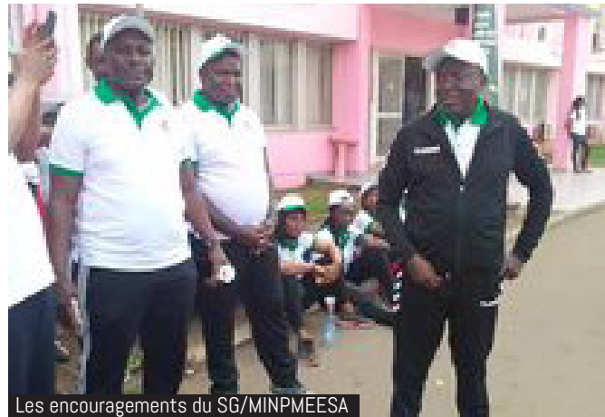
Les encouragements du SG/MINPMEESA

La 136 ème édition de la fête internationale de travail célébrée sous le thème « Monde du travail et pandémie du Covid-19 : garantir la santé des travailleurs, défi majeur dans la préservation des acquis des entreprises » a donné l'occasion au Ministère des PME, de l'Économie Sociale et de l'Artisanat de dérouler un ensemble d'activités réparties en deux principales articulations.