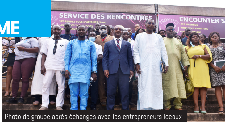
Photo de groupe après échanges avec les entrepreneurs locaux