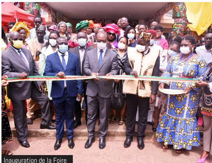
Inauguration de la Foire

La foire artisanale inaugurée le 19 janvier 2022 par le Ministre des PMEESA à l'occasion de la CAN a drainé du beau monde au Centre International de l'Artisanat de Yaoundé