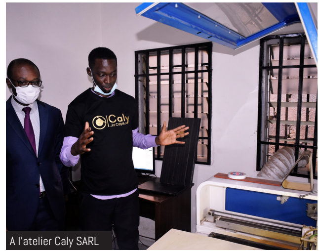
A l'atelier Caly SARL