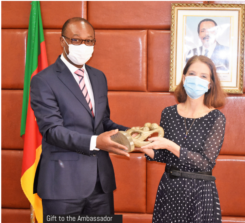
Gift to the Ambassador